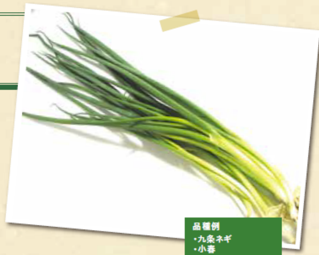
品種例 ・九条ネギ ・小春

種まき後、2ヵ月ほどで収穫適期を迎えます。苗から植えた場合は、草丈が15cm以上になった時が目安です。収穫のタイミングを逃すと、トウ立ちして一気に品質が落ちてしまいます。また、花芽が出た時はすぐに摘み取りましょう。